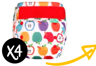
TOTBOTS Easyfit Star

Le système le plus simple : culotte imperméable et tissus absorbants sont cousus ensemble.