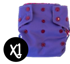
MON PETIT PAQUET