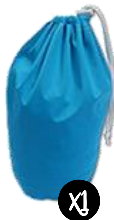
Grand sac pour stocker les couches sales