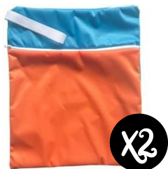
Sacs de transport imperméables