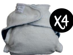
LULU NATURE Couche Lulu Dodo et boxer

Le système le plus absorbant : idéal pour la nuit. La couche, entièrement absorbante, se recouvre avec une culotte imperméable.